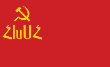
Sovyet Ermenistanı bayrağı 1936-1940

"Dün bu sorunu EKP-MK ve yoldaş Nerimanov'la inceledik. Daha fazla beklemektense bir an evvel girişimde bulunmanın doğru olacağı görüşünde birleştik" der. Ve devamla "eğer Ermenistan'da Sovyet iktidarının bir an evvel kurulması için girişimlerde bulunulmazsa, biraz daha gecikirse onu bekleyen tehlikenin daha korkunç sonuçlar doğuracağı kesindir. Askerler, subaylar ve halk bize başvurarak ne yapmaları ve nasıl hareket etmeleri gerektiğini soruyorlar. Bizlerin böyle bekleme içerisinde olmamız, halk arasında, sanki bizler de onları terk etmiş ve kaderiyle başbaşa bırakmış etkisi yaratmaktadır" der. Artık bu saatten sonra Stalin derhal Lenin'e ulaşarak, "Ermenilerin ordusunun olmadığını, Türklerin istedikleri zaman bütün Ermenistan'ı hiç zorlanmadan kısa bir zamanda işgal edebileceklerini" aktarır.