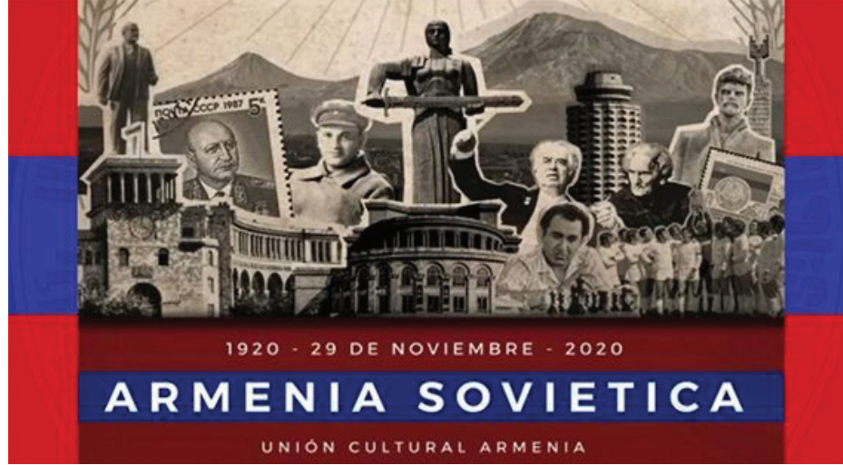
Arjantinli Ermenilerin 100. yıl video konferans yolu ile dünyanın çeşitli ülkelerinden sosyalist-komünist örgütler aracılığı ile gerçekleştirdikleri konferans görseli

İçinden geçtiğimiz yeni bir yüzyılda, Ermeniler ve tüm insanlık adına zor ve acının hakim olduğu kara tablo, bizleri