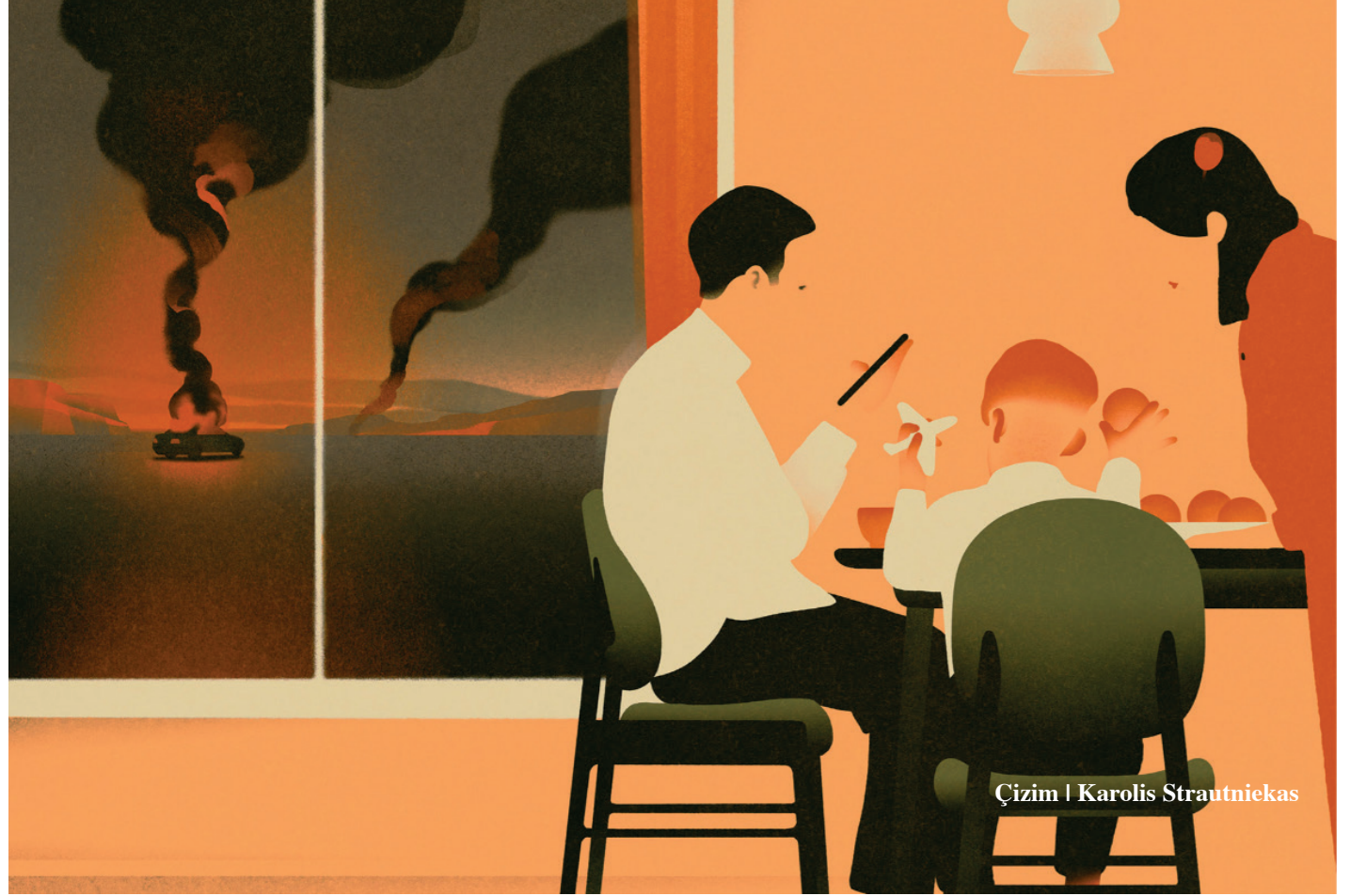
Çizim | Karolis Strautniekas

Bu anlamda, bir filozofun süregelen düşünsel yolculuğu boyunca gerçekleştirdiği iradi ve bilge eylem, kendisinin en sadık yoldaşdır. Doğaya,