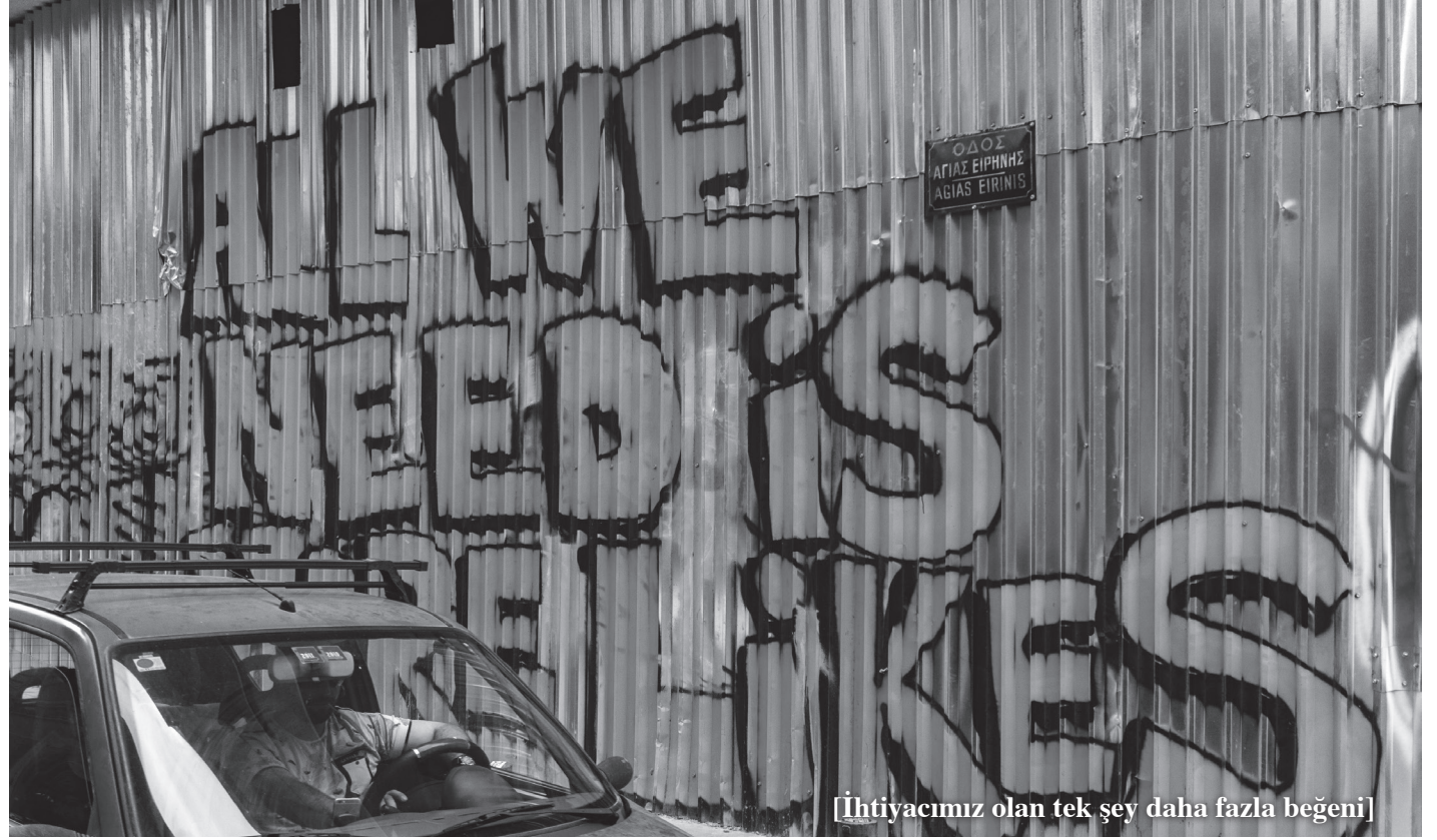
[İhtiyacımız olan tek şey daha fazla beğeni]

Nano ve mikro teknolojilerin toplumsal üretim ve sosyal yaşam alanlarına kadar indirilmesi, sürekli yeni yeni pazar ve rekabet alanlarının açılması, bio-kimyevi, bio-genetik alanlardaki atılımlar bu devasa değişimlere başka bariz örneklerdir. Dahası artık tıbbi